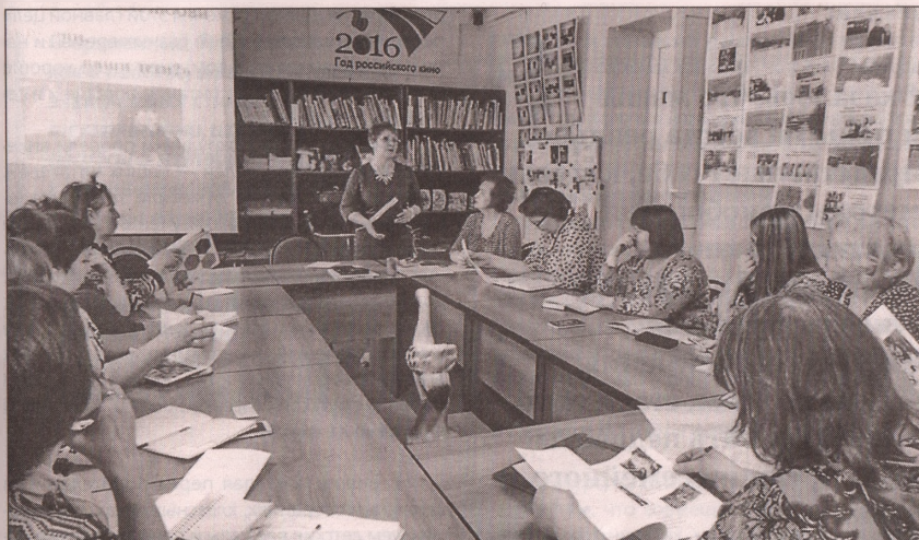
■ В семинарах «Академии родительского образования» принимают участие специалисты сельских библиотек

Зная о нашей интересной работе с детьми и взрослыми, сотрудники Управления по молодёжной политике, культуре и спорту районной администрации обратились к ЦДБ с просьбой открыть в наших стенах Клуб молодых семей. На первое же мероприятие пришло 10 семей. Сегодня на этих встречах ребяташки и взрослые занимаются совместным творчеством, разрабатывают макет генеалогического древа,