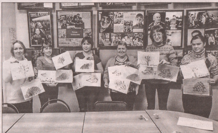
■ Мастер-класс для родителей: не все взрослые умеют так же здорово рисовать, как малыши

Проект «Розовый пингвин» разработан в прошлом году. Созданная в его рамках библиостудия объединила усилия педагогов, родителей, библиотекарей в деле воспитания умного, грамотного, талантливого читателя. Мы не ставили цель