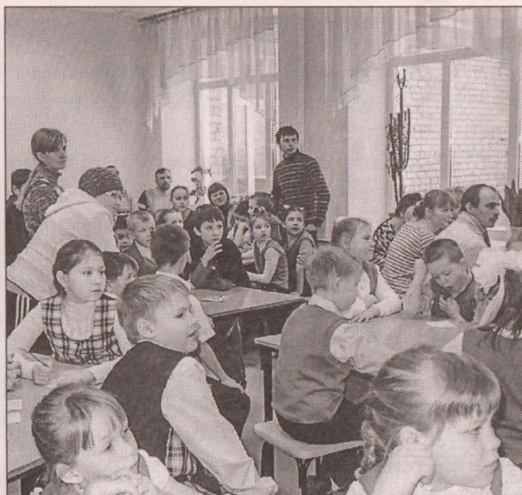
■ Совместная интеллектуальная игра родителей и детей

знакомятся с литературой, проводят тематические посиделки за чашкой чая.