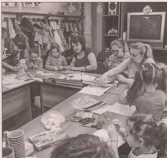
■ Работа Клуба молодых семей на базе библиотеки