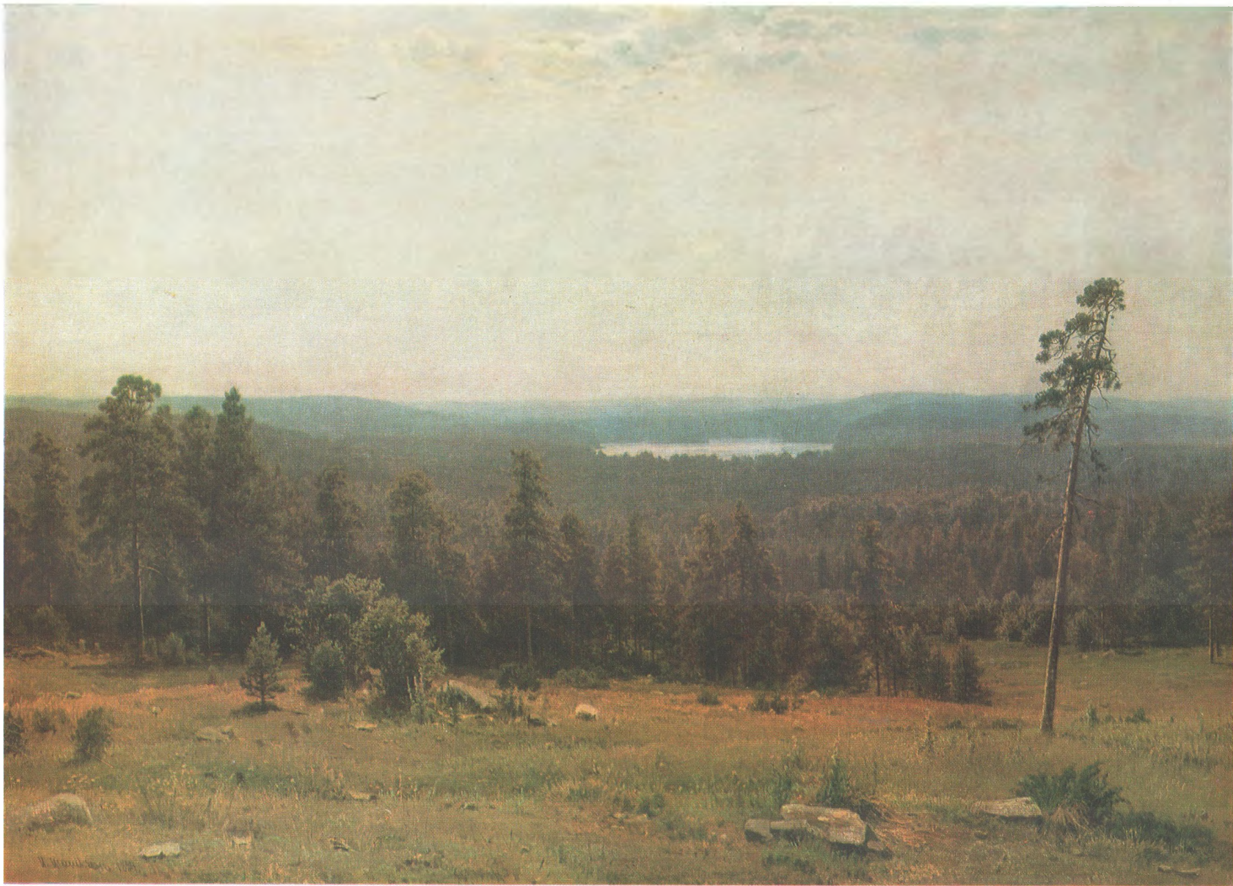
И. И. ШИШКИН (1832–1898) Лесные дали. 1884 Холст, масло. 112,8×164 Государственная Третьяковская галерея