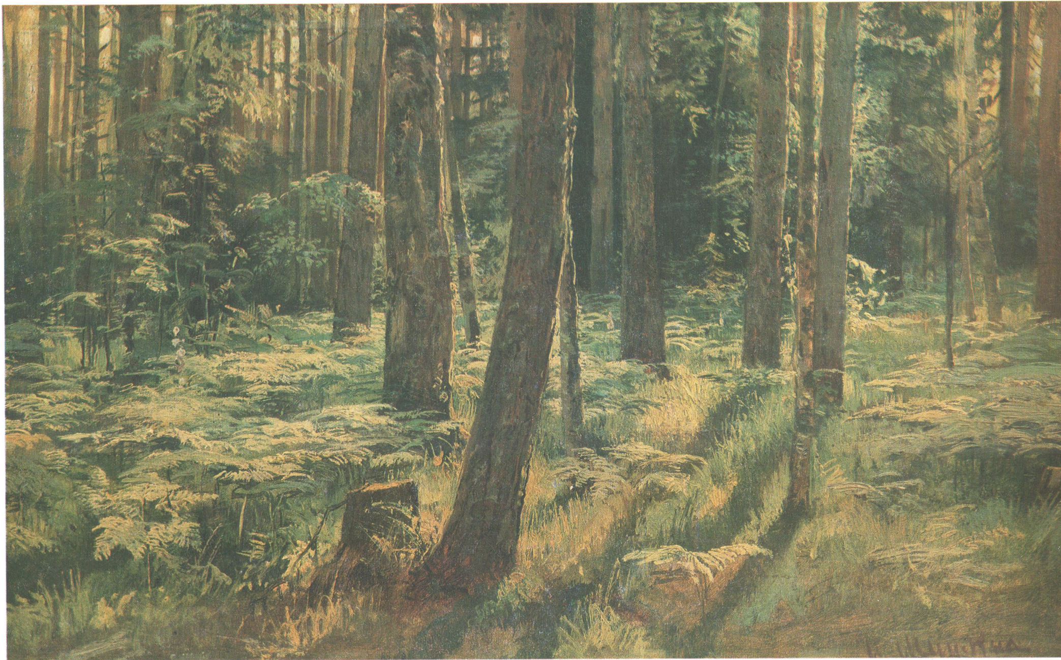
И. И. ШИШКИН (1832—1898) Папоротники в лесу. Сиверская. Этюд. 1883 Холст на картоне, масло. 36,2×59,6 Государственная Третьяковская галерея