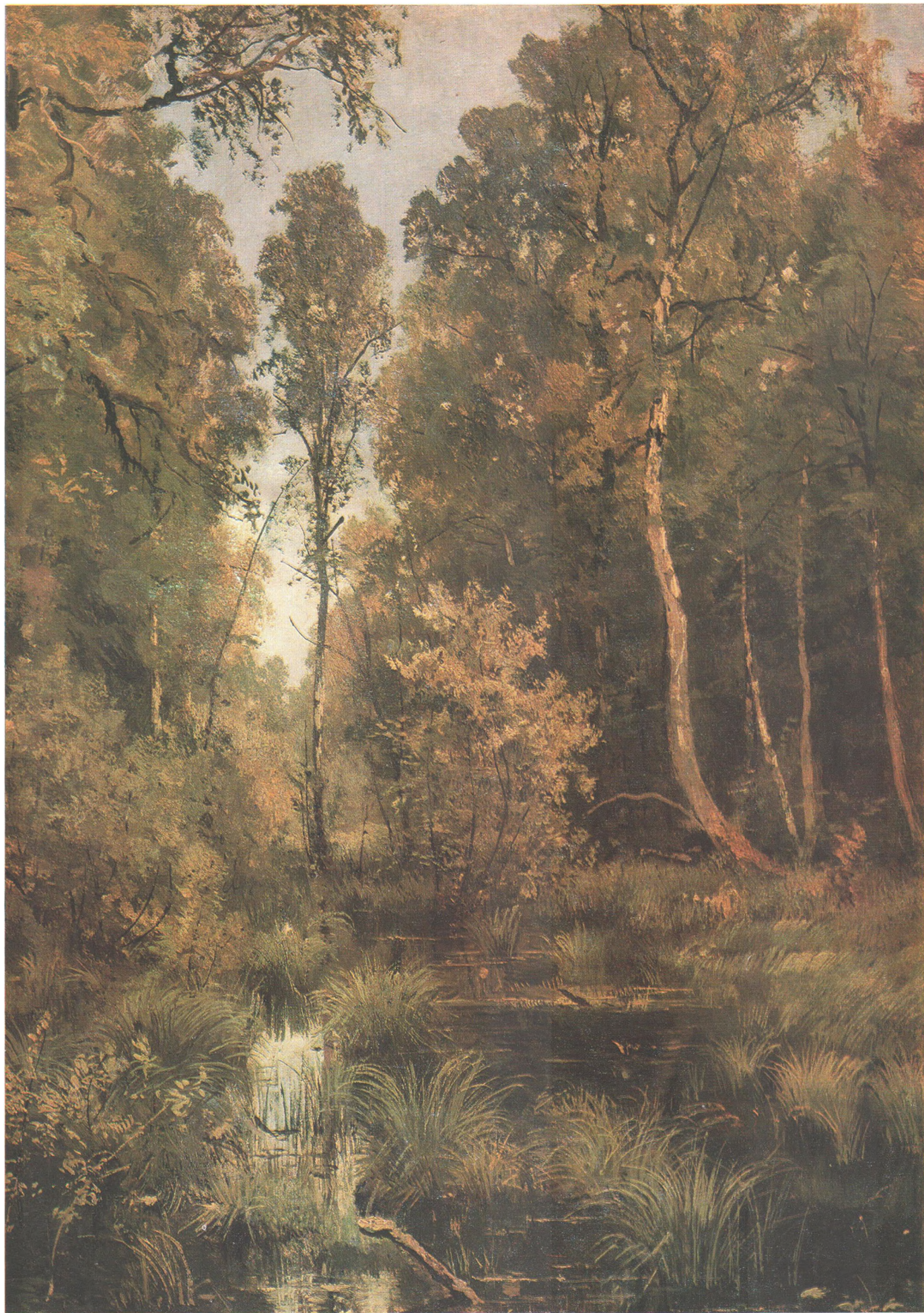
И. И. ШИШКИН (1832--1898) Заросший пруд у опушки леса. Сиверская. 1883 Холст, масло. 56×42 Государственная Третьяковская галерея

© «Изобразительное искусство». Москва, 1986 11-384 Доп. тир 40 000. Ц. 6 к. Т. № 5. Зак. 3750