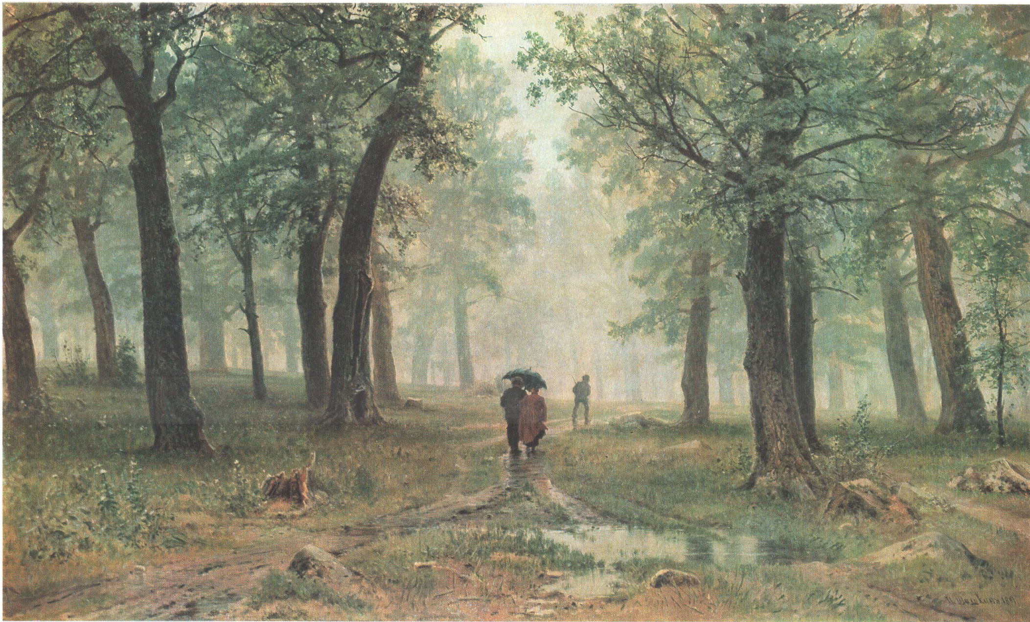
И. И. ШИШКИН (1832 - 1898) Дождь в дубовом лесу. 1891 Холст, масло. 124×203 Государственная Третьяковская галерея

С «Искусственное искусство», Москва, 1986 11-384 Доп. тир. 40 000. Ц. 6 к. Т. № 5. Зак. 3750