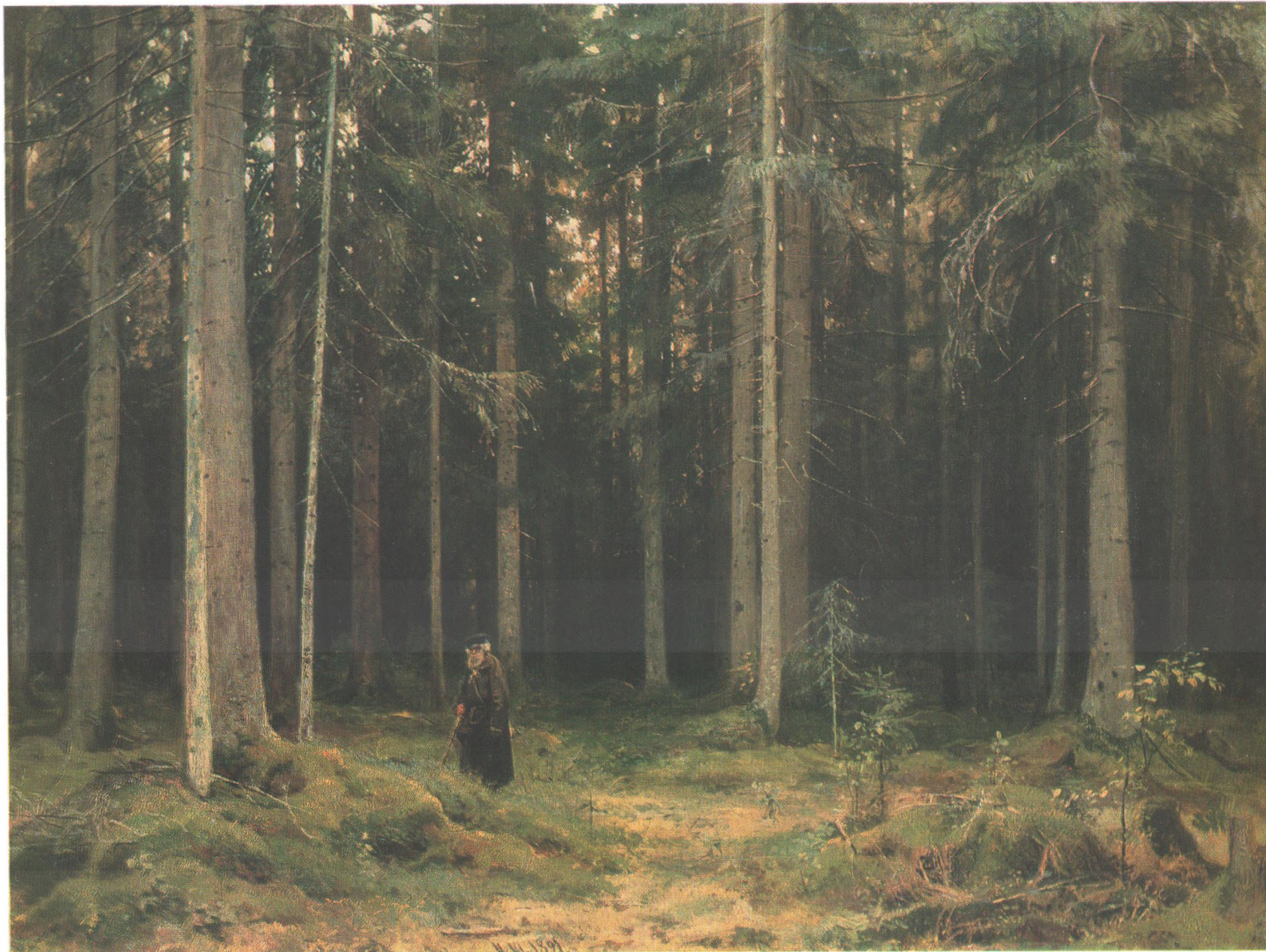
И. И. ШИШКИН (1832--1898) В лесу графини Мордвиновой. Петергоф. 1891 Холст, масло. 81×108 Государственная Третьяковская галерея

© «Искусственное искусство», Москва, 1986 11-384. Дип. зипр. 40 000. Ц. 6 к. Т. № 5. Зал. 3750