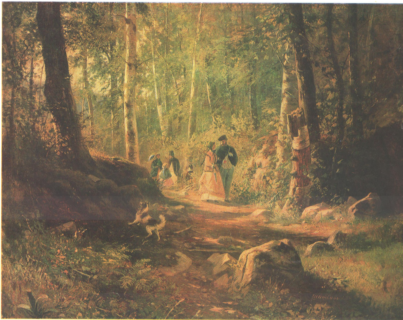
И. И. ШИШКИН (1832—1898) Прогулка в лесу. 1869 Холст, масло. 34,3×43,3 Государственная Третьяковская галерея

(С) «Изобразительное искусство», Москва, 1986 П-384. Доп. тир. 40 000. Ц. 6 к. Т. № 5. Зап. 3750