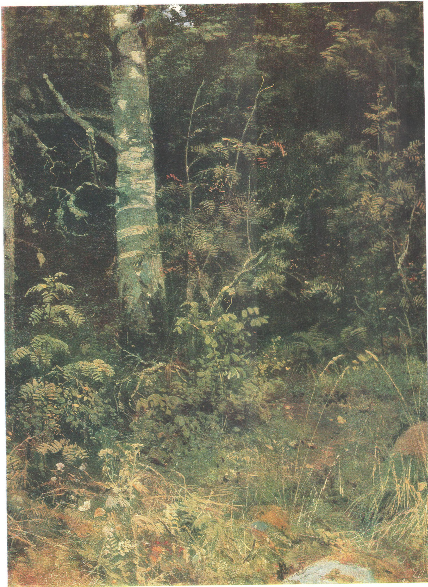
И. И. ШИШКИН (1832—1898) Береза и рябинки. Этюд. 1878 Холст, масло. 38×28,5 Государственная Третьяковская галерея

© «Изобразительное искусство», Москва, 1986 11-384. Доп. тир. 40 000. Ц. 6 к. Т. № 5. Зак. 3750