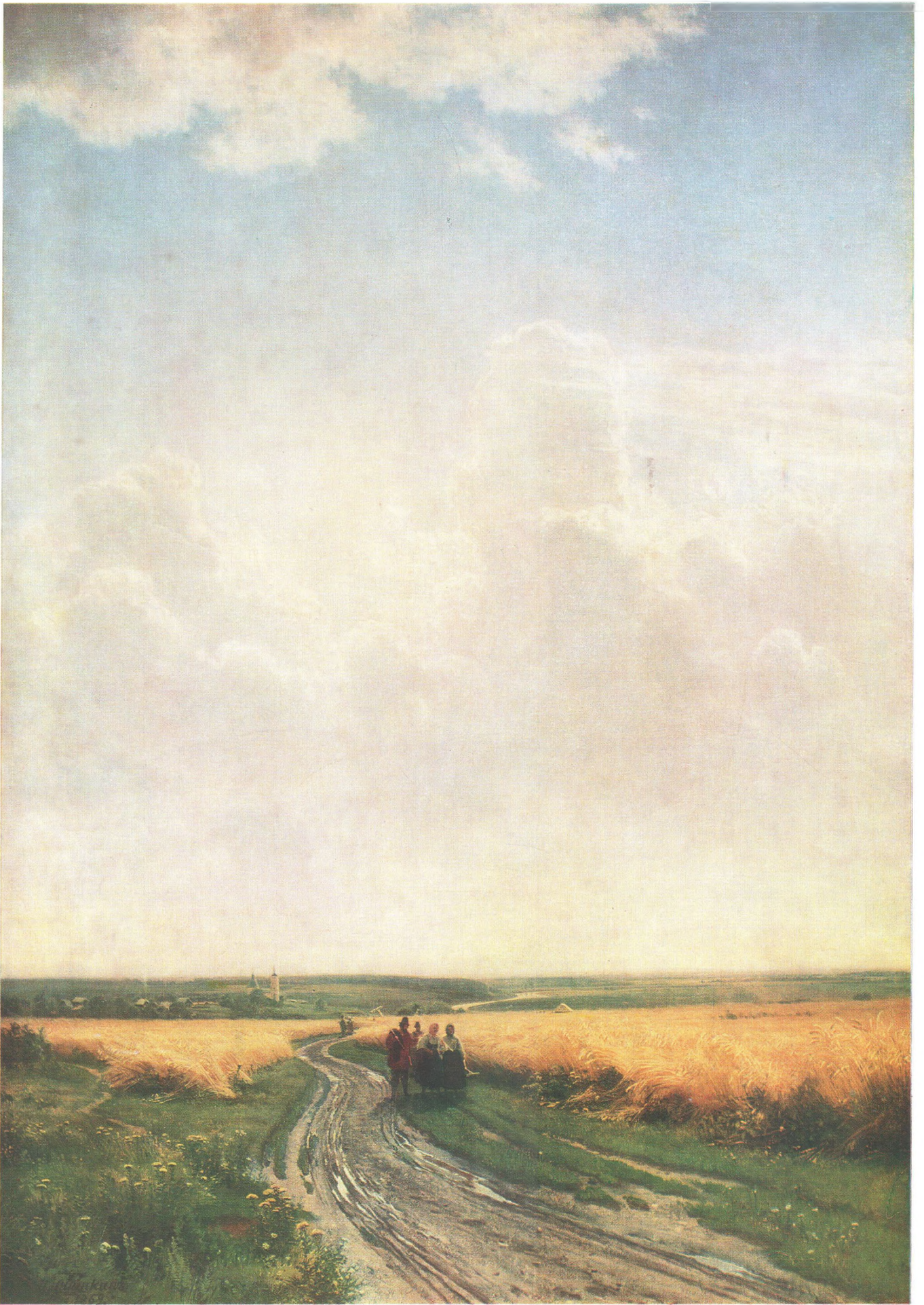
И. И. ШИШКИН (1832—1898) Полдень. В окрестностях Москвы. 1869 Холст, масло. 111,2×80,4 Государственная Третьяковская галерея

© «Изобразительное искусство». Москва, 1986 11-384. Доп. тир. 40 000. Ц. 6 к. Т. № 5. Зак. 3750