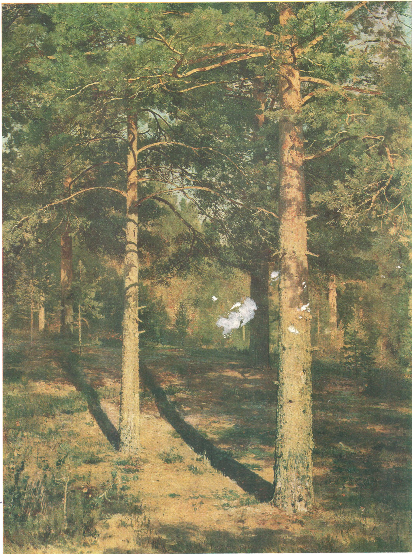
И. И. ШИШКИН (1832—1898) Сосны, освещенные солнцем. Этюд. 1886 Холст, масло. 102×70,2 Государственная Третьяковская галерея

© «Изобразительное искусство». Москва. 1986 11-384. Доп. тир. 40 000. Ц. 6 к. Т. № 5. Зак. 3750