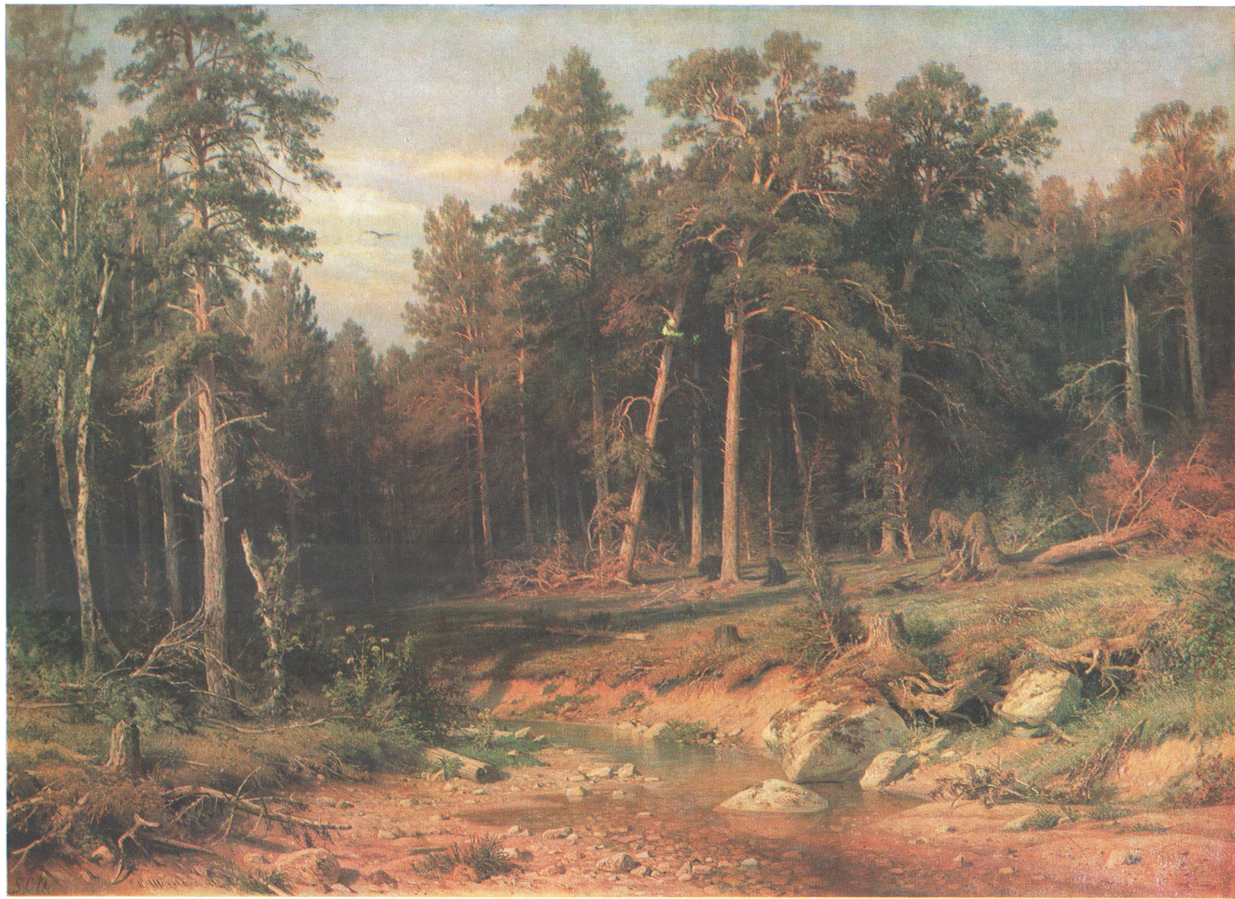
И. И. ШИШКИН (1832—1898) Сосновый бор. Мачтовый лес в Вятской губернии. 1872 Холст, масло. 117×165 Государственная Третьяковская галерея

© «Изобразительное искусство», Москва, 1986 11.384 Доп. тир. 40.000. Ц. 6 к. Т. № 5. Зая. 3750