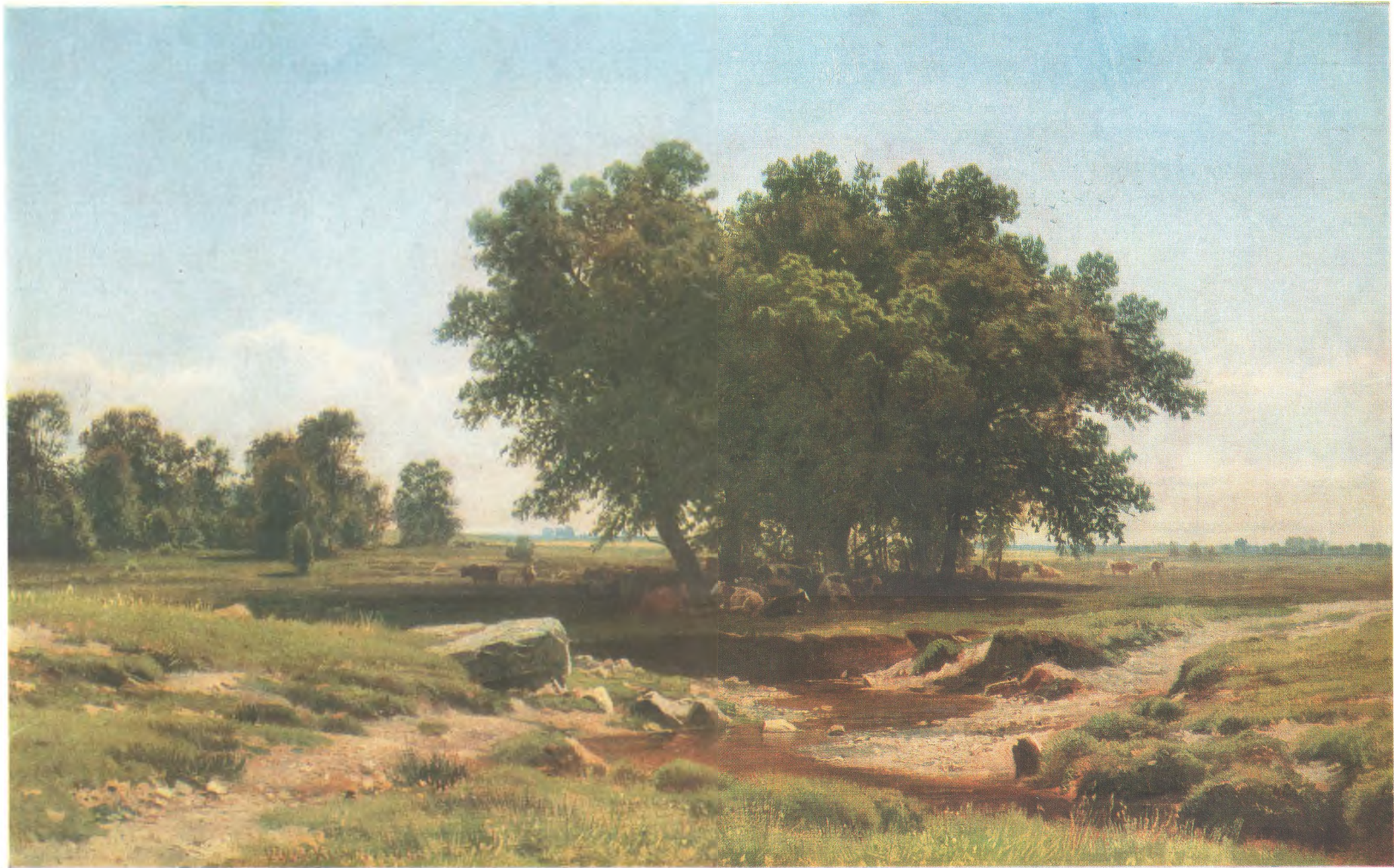
И. И. ШИШКИН (1832—1898) Дубки. 1886 Холст, масло. 37,5×62 Государственная Третьяковская галерея

© «Изобразительное искусство». Москва, 1986 11-384. Доп. тир. 40 000. Ц. 6 к. Т. № 5. Зак. 3750