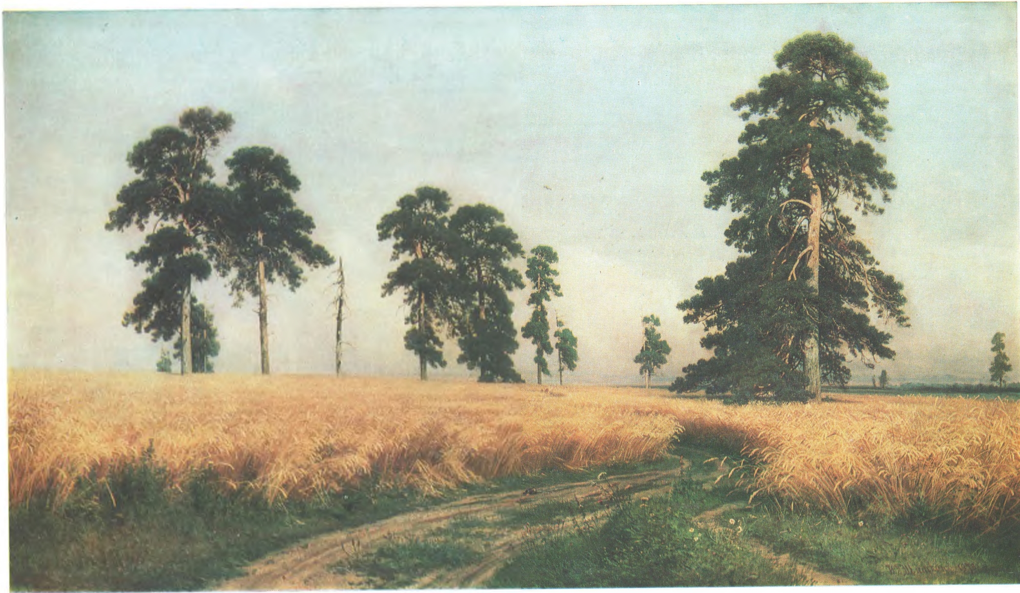
И. И. ШИШКИН (1832 - 1898) Рождь. 1878 Холст, масло. 107×187 Государственная Третьяковская галерея

© «Изобразительное искусство». Москва, 1986 11-384 Доп. тир. 40 000. Ц 6 к. Т. № 5. Зак. 3750