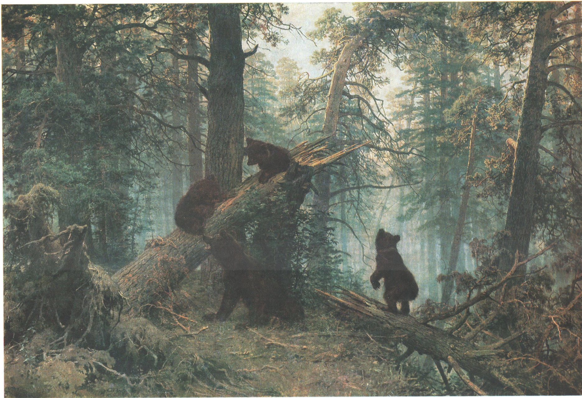
И. И. ШИШКИН (1832—1898) Утро в сосновом лесу. 1889 Холст, масло. 139×213 Государственная Третьяковская галерея

С: «Изобразительное искусство». Москва, 1986 11-384. Доп. тир. 40 000. Ц. 6 к. Т. № 5. Зак. 3750