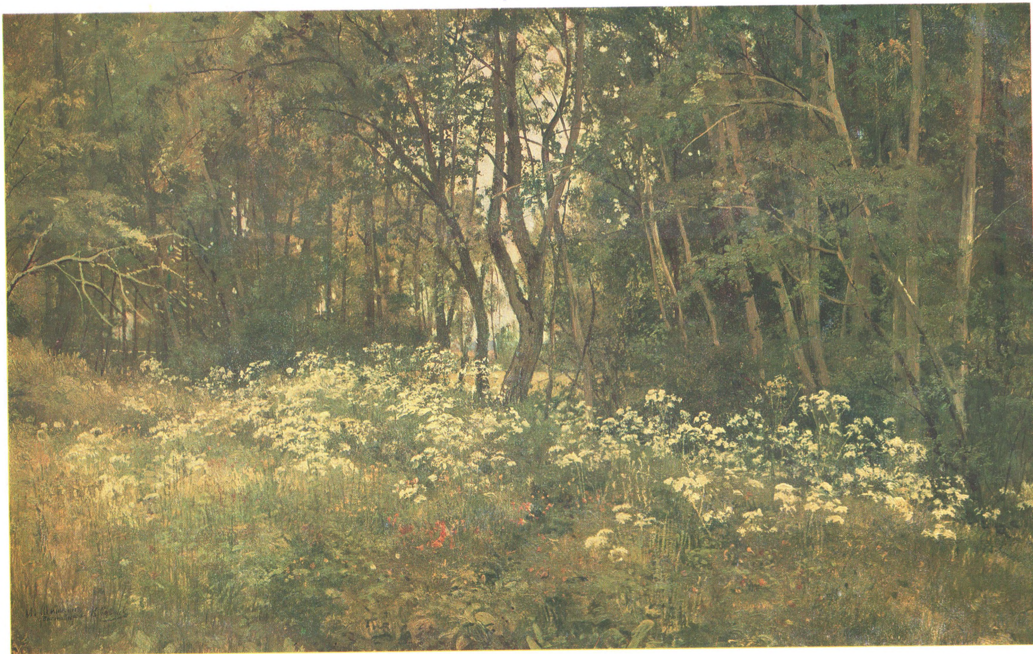
И. И. ШИШКИН (1832—1898) Цветы на опушке леса. Этюд для картины «Лес на берегу моря» Холст, масло, 42×67 Государственная Третьяковская галерея