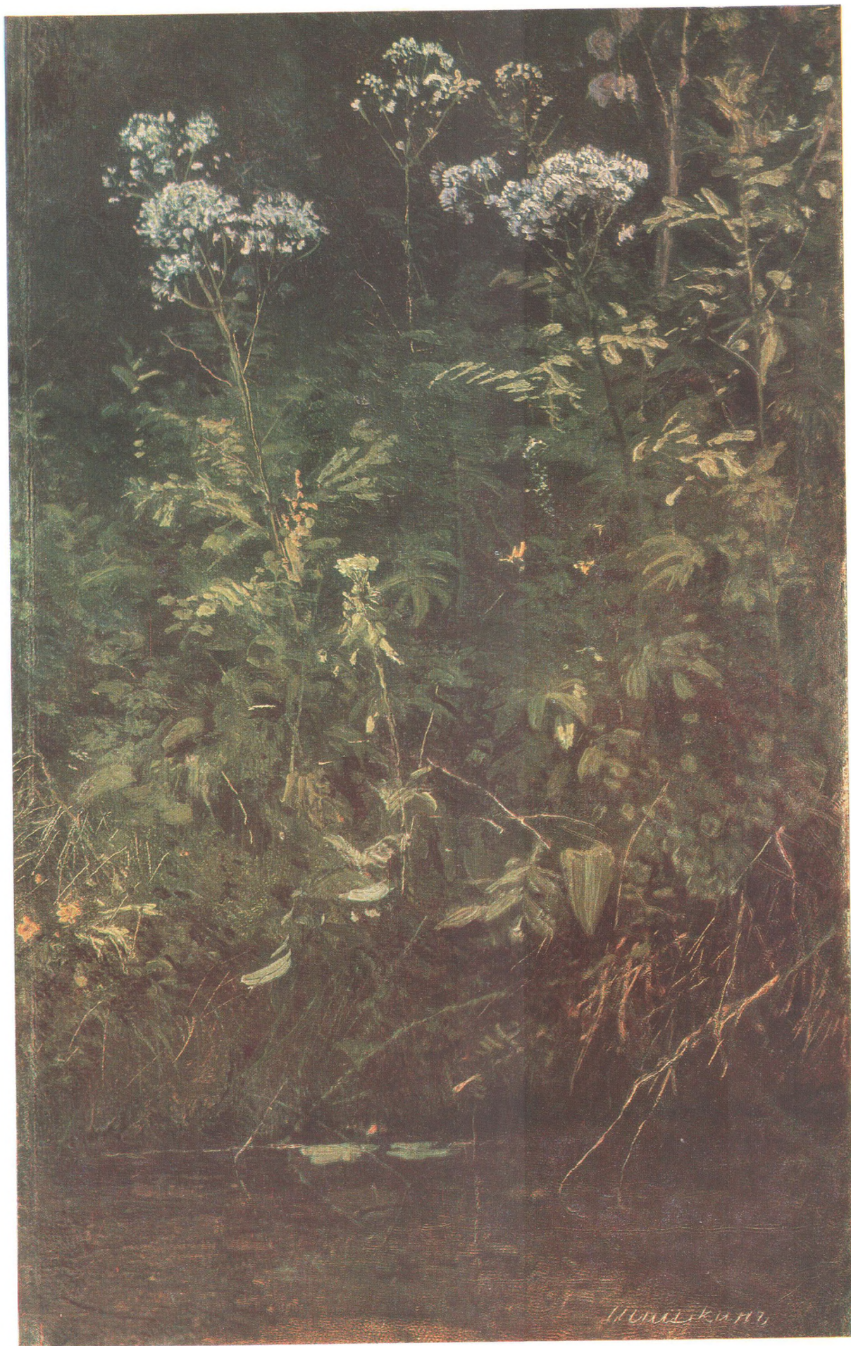
И. И. ШИШКИН (1832—1898) Полевые цветы у воды. Этюд Холст на картоне, масло. 22,4×14,2 Государственная Третьяковская галерея

© «Изобразительное искусство», Москва, 1986 11-384. Доп. тир. 40 000. Ц. 6 к. Т. № 5. Зак. 3730