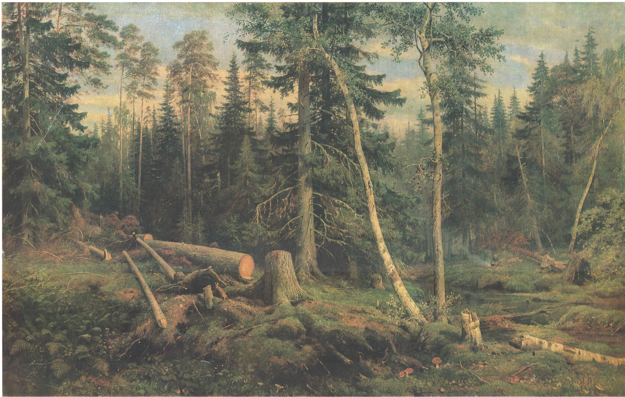
И. И. ШИШКИН (1832—1898) Рубка леса. 1867 Холст, масло. 122×194 Государственная Третьяковская галерея

© «Изобразительное искусство», Москва, 1986 11-384. Доп. тир. 40 000. Ц. 6 к. Т. № 5. Элк. 3750